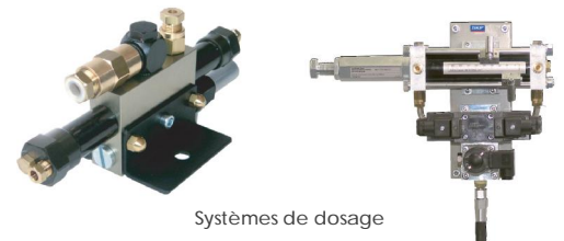
Systèmes de dosage