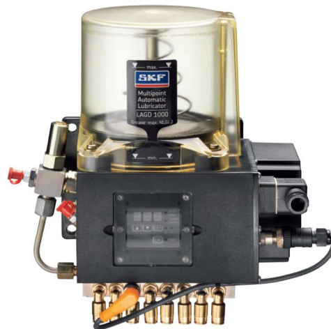
Système de graissage multipoints avec réservoir

Diminution du nombre et de la durée des interventions de lubrification manuelle.